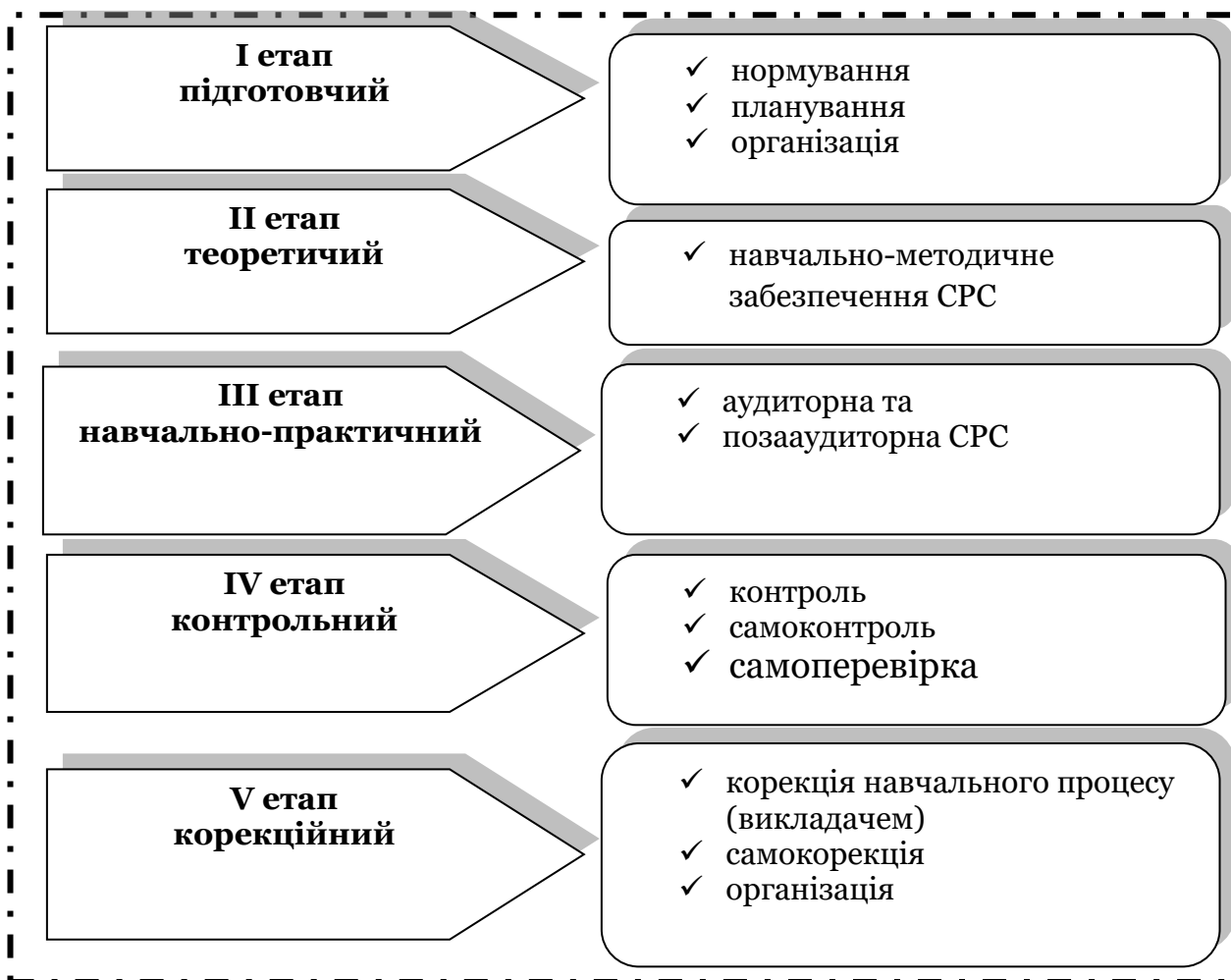
Рис. 1 Етапи самостійної роботи (складено автором на основі [4]).

Організація СПР з боку ІФНМУ здійснюється за п'ятьма етапами (рис. 1): підготовчим, теоретичним, навчально-практичним, контрольним, корекційним (рис. 1).